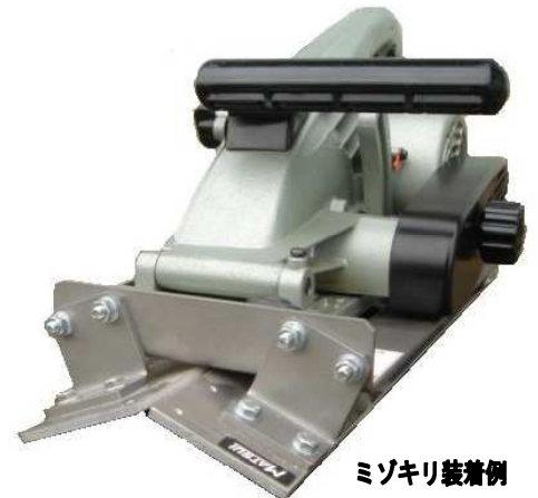
ミゾキリ装着例 *マキタ製ミゾキリ (3803ASP、3804A) に対応